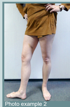
Photo example 2

Иногда синяки появляются через некоторое время и/или меняют свой размер. Поэтому важно указывать дату фотографий.