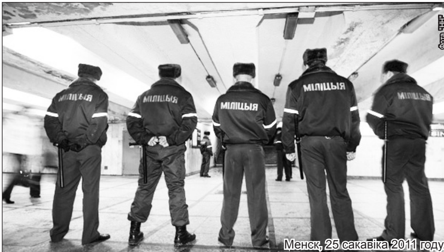
Менск, 25 сакавіка 2011 году.