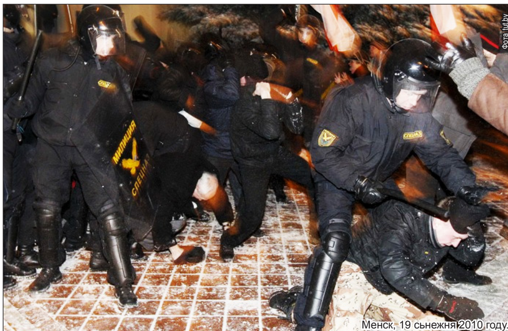
Менск, 19 снежня 2010 году.