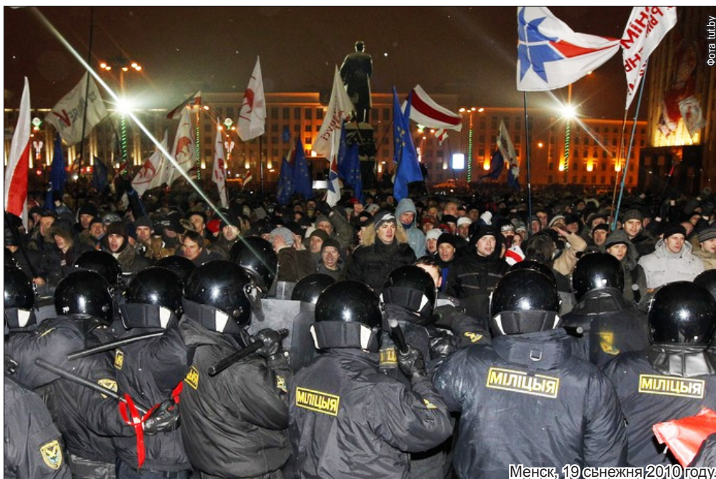
Менск, 19 снежня 2010 году.

Праваабарончыя матэрыялы можна таксама прачытаць на сайтах: www.spring96.org ; www.charter97.org ; www.baj.by