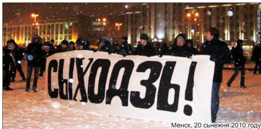
Менск, 20 снежня 2010 году.

Удзельнікі другога дня "Плошчы 2010" здолелі прастаяць ня больш за