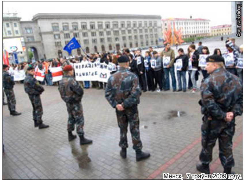
Менск, 7 траўня 2009 году.

Насупраць іх, таксама ланцугом, сталі байцы міліцэйскага спецназу. Яны не давалі ўдзельнікам акцыі набліжацца да прыдарожнай часткі. Паводле ўдакладненых зьвестак, у Менску затрыманая каля 30 уд-