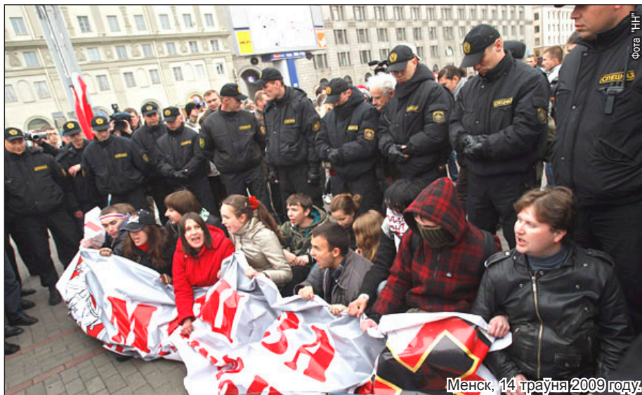
Менск, 14 траўня 2009 году.