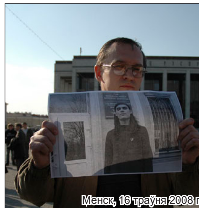
Менск, 16 траўня 2008 г.

У гэты ж дзень актывісты салігорскай філіі Маладога Фронту правялі акцыю, прысьвечаную агульнабеларускай кампаніі "Горад наш!" Нацыянальныя палотнішчы ўпрыгожылі галоўны праспект гораду шахцёраў.